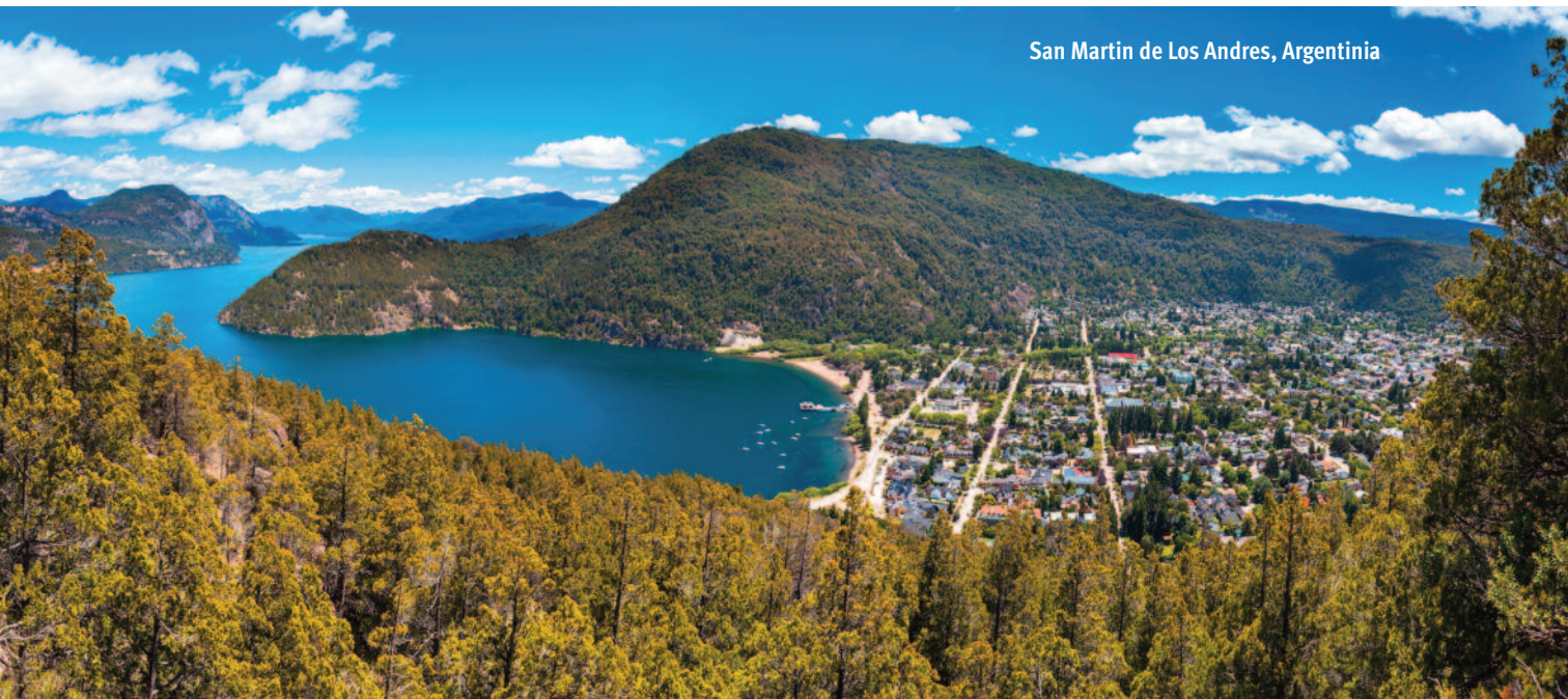
San Martín de los Andes, Argentina