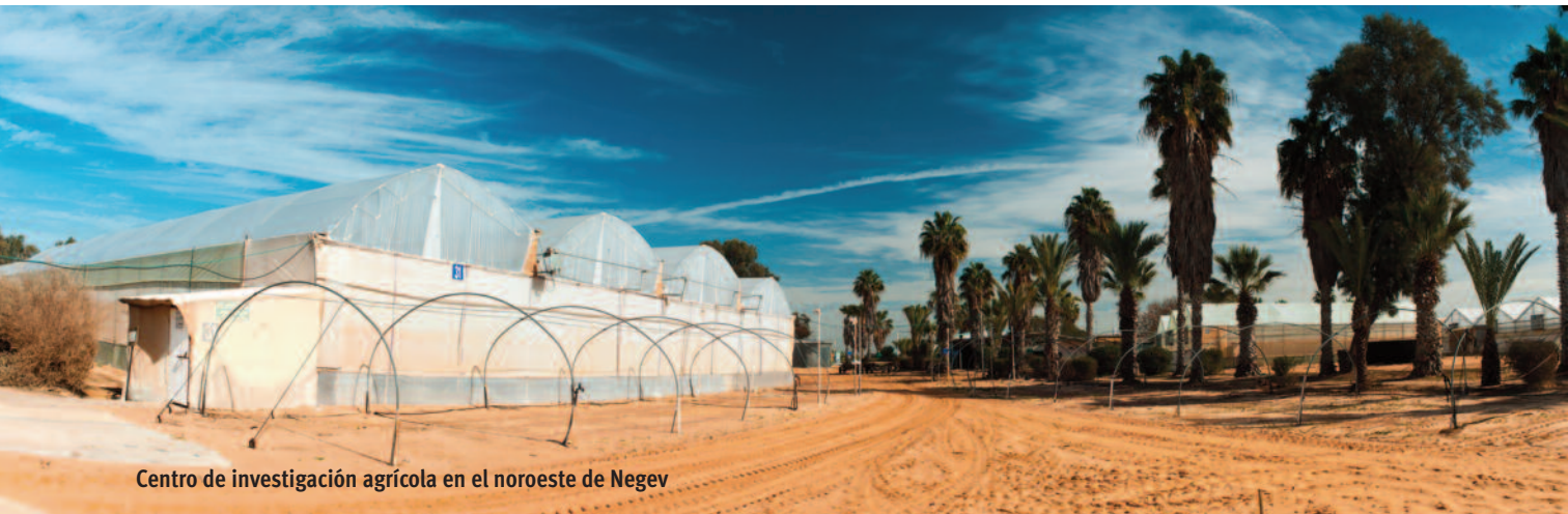
Centro de investigación agrícola en el noroeste de Negev

Alrededor del 60% del territorio israelí es desierto —llueve poco o nada. Si no fuera un desierto de rocas, sino de arena, la arena avanzaría cada vez más, porque apenas hay vegetación. Sin embargo, a pesar de las difíciles condiciones climáticas, se pueden descubrir grandes extensiones de terreno agrícola, ya que Israel aplica diversos métodos para ello, y lo hace con mucho éxito. Una de las empresas israelíes que se enfrenta a los retos del clima desér-