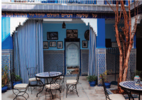
Sinagoga en Marrakech, Marruecos

Israel y Marruecos acaban de establecer relaciones diplomáticas tras la adhesión del país norteafricano a los Acuerdos de Abraham. Marruecos es considerado uno de los países árabes-musulmanes moderados y, tras la Guerra del Golfo en 1991, también se había producido un avance en el curso de los esfuerzos de paz, tras lo cual, sin embargo, el silencio se estableció pronto otra vez. Este hecho llama la atención, especialmente porque son numerosos los judíos de origen marroquí que viven en Israel y a los que les gusta viajar con frecuencia a su país de origen. Marruecos también cuenta con una comunidad judía con una floreciente historia, especialmente en lo que respecta a la integración general de los judíos en la sociedad marroquí musulmana. Ahora, sin embargo, ambos países están dando grandes pasos el uno hacia el otro. Esto significa mucho más que vuelos directos y varias visitas de Estado. Hasta ahora, Marruecos era el único país árabe que contaba con un Museo Judío, situado en Casablanca y dedicado tanto a la historia de los judíos en el país como a la de las comunidades de emigrantes judeo-marroquíes. Hace unas semanas, Marruecos inauguró en la Escuela Politécnica de Marrakech, que lleva el nombre del rey Mohammed VI, una si-